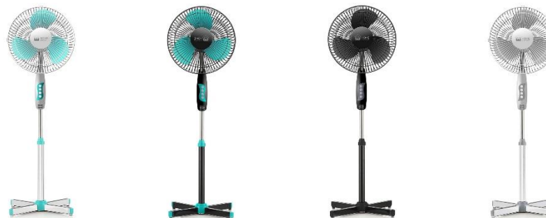
Белый/зеленый Черный/зеленый Черный/черный Белый/серый